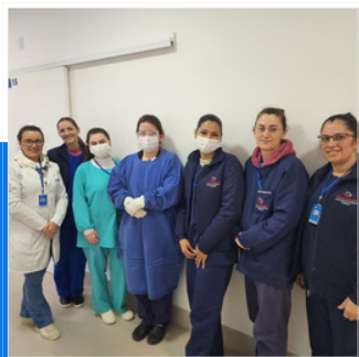
CAPACITAÇÃO USO DE EPI'S E PARAMENTAÇÃO EM ISOLAMENTOS.