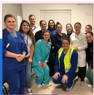
AÇÃO ABRIL VERDE