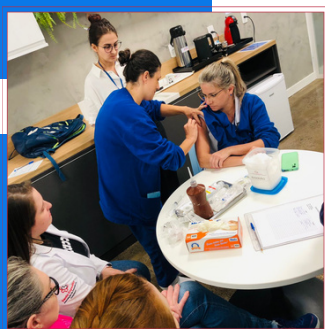
CAPACITAÇÃO PUNÇÃO SUBCUTÂNEA.