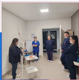
CAPACITAÇÃO INTUBAÇÃO OROTRAQUEAL E MANUSEIO DE BOMBA INFUSÃO8.JPG