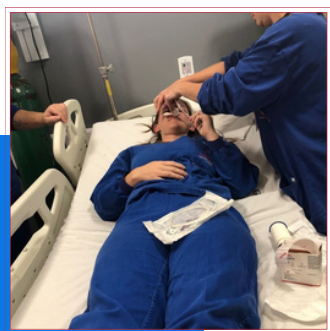
- CAPACITAÇÃO SONDAGENS