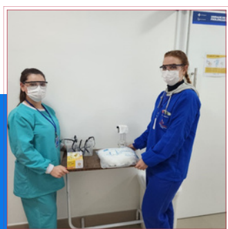
CAPACITAÇÃO USO DE EPI'S E PARAMENTAÇÃO EM ISOLAMENTOS